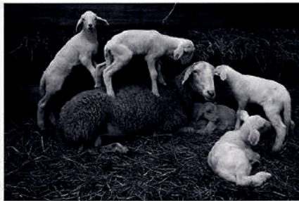
1º Premio: "Encollicas" Nicolás Lalcoste Dodón